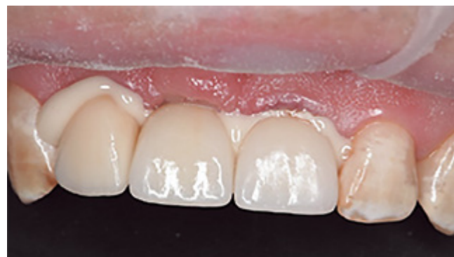
Рис. 8. Фиксация коронок