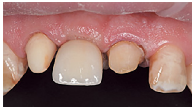
Рис. 7. Укрепления коронки на винтовой фиксации с опорой на дентальный имплантат в позиции 1.1