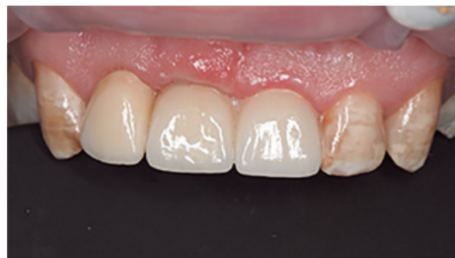
Рис. 9. Вид ортопедической реабилитации пациента через 7 дней после фиксации коронок из диоксида циркония на стеклоиономерный цемент «Полиакрилин»

дней временная конструкция снята. Для достижения оптимального ионного обмена между структурами зуба и стеклоиономерным цементом проведена обработка культей 1.2, 2.1 зубов кондиционером – раствором полиакриловой кислоты в течение 10 секунд (рис. 6). Далее прошла установка коронки с винтовой фиксации на дентальный имплантат в позиции 1.1 (рис. 7), фиксация постоянных одиночных коронок из диоксида циркония на стеклоиономерный цемент «Полиакрилин» (рис. 8).