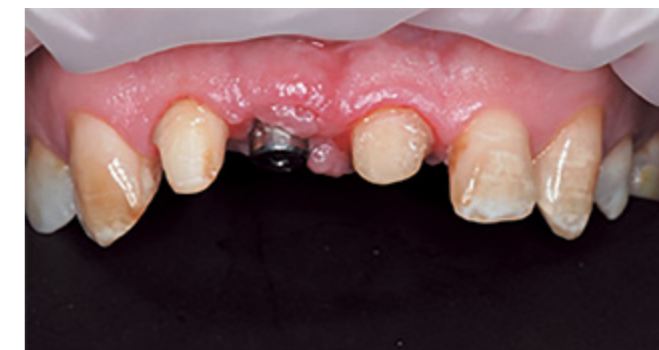
Рис. 5. Клиническая ситуация через 3 месяца после установки имплантата