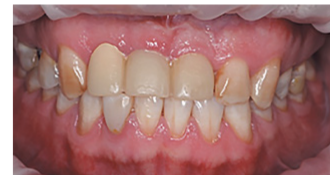
Рис. 4. Исходная клиническая ситуация

Диагноз: частичная вторичная адентия верхней челюсти (K08.1).