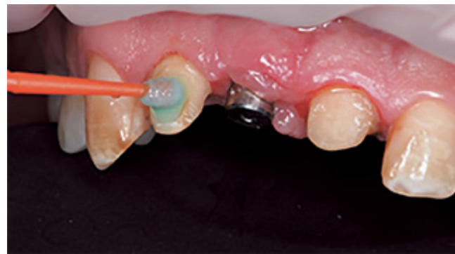
Рис. 6. Нанесение кондиционера на культы 1.2, 2.1 зубов