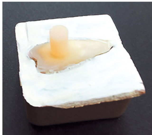
Рис. 3. Образец стеклоиономерного цемента в соединении с дентином зуба для испытания адгезионной прочности методом сдвига

* Различия адгезионной прочности при сдвиге достоверны при p < 0,05 .